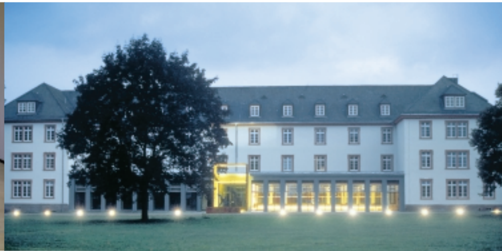
Der historische Bau mit modernem Eingangportal