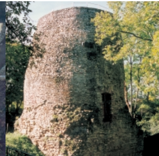
Der Drussustein – das älteste steinerne Bauwerk in Deutschland

Auf der Mainzer Zitadelle finden Sie beides. Den Reiz dieses Standortes hatten schon die Römer entdeckt. Hier errichteten sie den – übrigens heute noch erhaltenen – Drususstein als weithin sichtbare Landmarke. Die Zitadelle entstand im 17. Jahrhundert im Auftrag des Kurfürsten Lothar von Schönborn als Festungsanlage, war später dann Kaserne und wurde bis vor Kurzem als Schule genutzt. Mit großem Engagement und Einfühlungsvermögen in die historische Bausubstanz hat die Stadt Mainz die Restaurierung des Gebäudes durchgeführt. Entstanden ist dabei eine gelungene Symbiose aus alter Architektur der Fassaden in Verbindung mit einer funktionalen, bestechenden Eleganz in den Innenstrukturen. Interessierten Firmen, Vereinen, Agenturen und Institutionen steht die Mainzer Zitadelle heute für Tagungen, Kongresse, Seminarreihen, Vorträge, Events und musische oder kulturelle Veranstaltungen offen. Gastgeber ist die Gebäudewirtschaft Mainz, die hier sehr eindrucksvoll demonstriert, wie harmonisch das Miteinander von Geschichte und Gegenwart erlebt werden kann. Kernstück der Zitadelle ist der Drusus-Saal, der mit dem entsprechenden multimedialen Equipment die idealen technischen Voraussetzung bietet, Ihre Ideen umzusetzen.