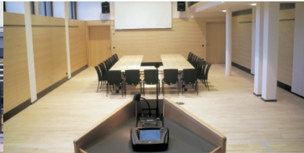
Konferenzatmosphäre im Drusussaal