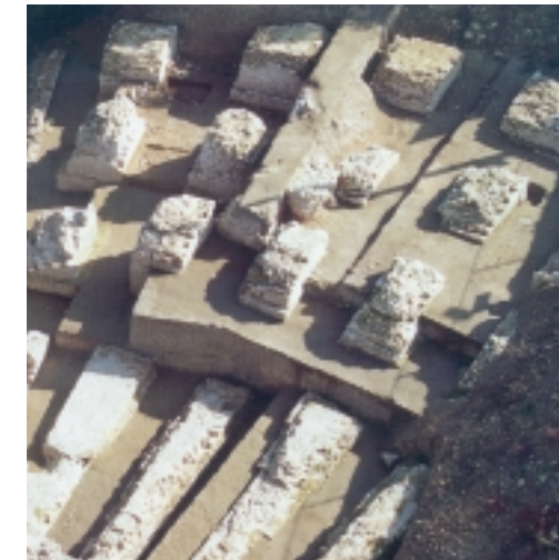
Ausgrabungsfunde des römischen Bühnentheaters