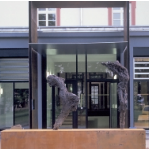
Skulptur im Eingangsbereich von Karlheinz Osswald